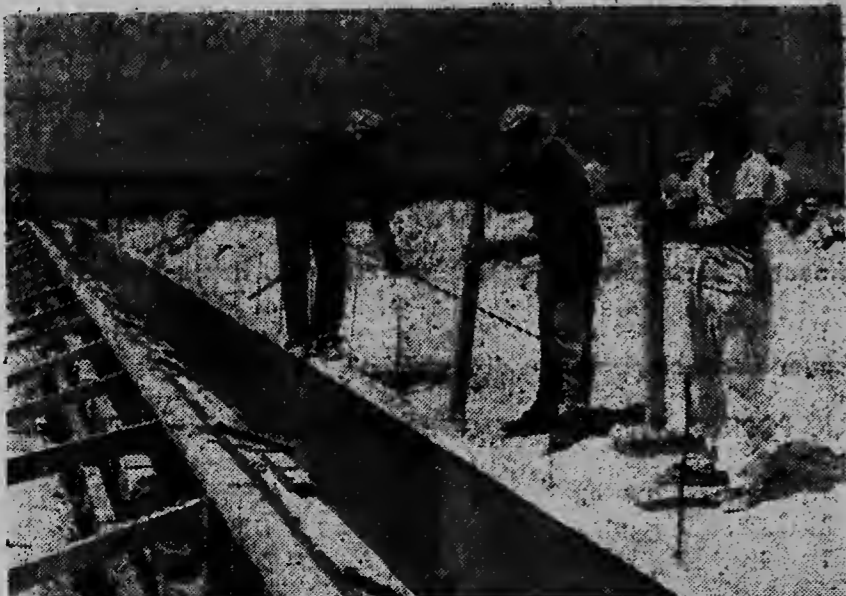
Rondo di e prome fundeshinan nan ta stamp santu los, hasiele parew y muhele continuamente.